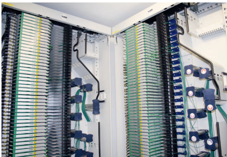
Le réseau de fibre optique FTTH permet l'accès à Internet à très haut débit. À Morges, l'exploitation de ce réseau sera confiée à une nouvelle filiale du groupe zougais, appelée Morges4net SA.

Les deux groupes prévoient la réalisation d'autres réseaux de fibre optique dans la zone de desserte du premier fournisseur d'énergie de Suisse romande. L'énergéticien vaudois alimente quelque 300 000 clients dans près de 300 communes vaudoises. « N'étant pas nous-mêmes actifs sur le marché des services de télécommunication, ce partenariat permet la mise en commun des compétences des deux partenaires, afin de proposer une infrastructure de qualité au